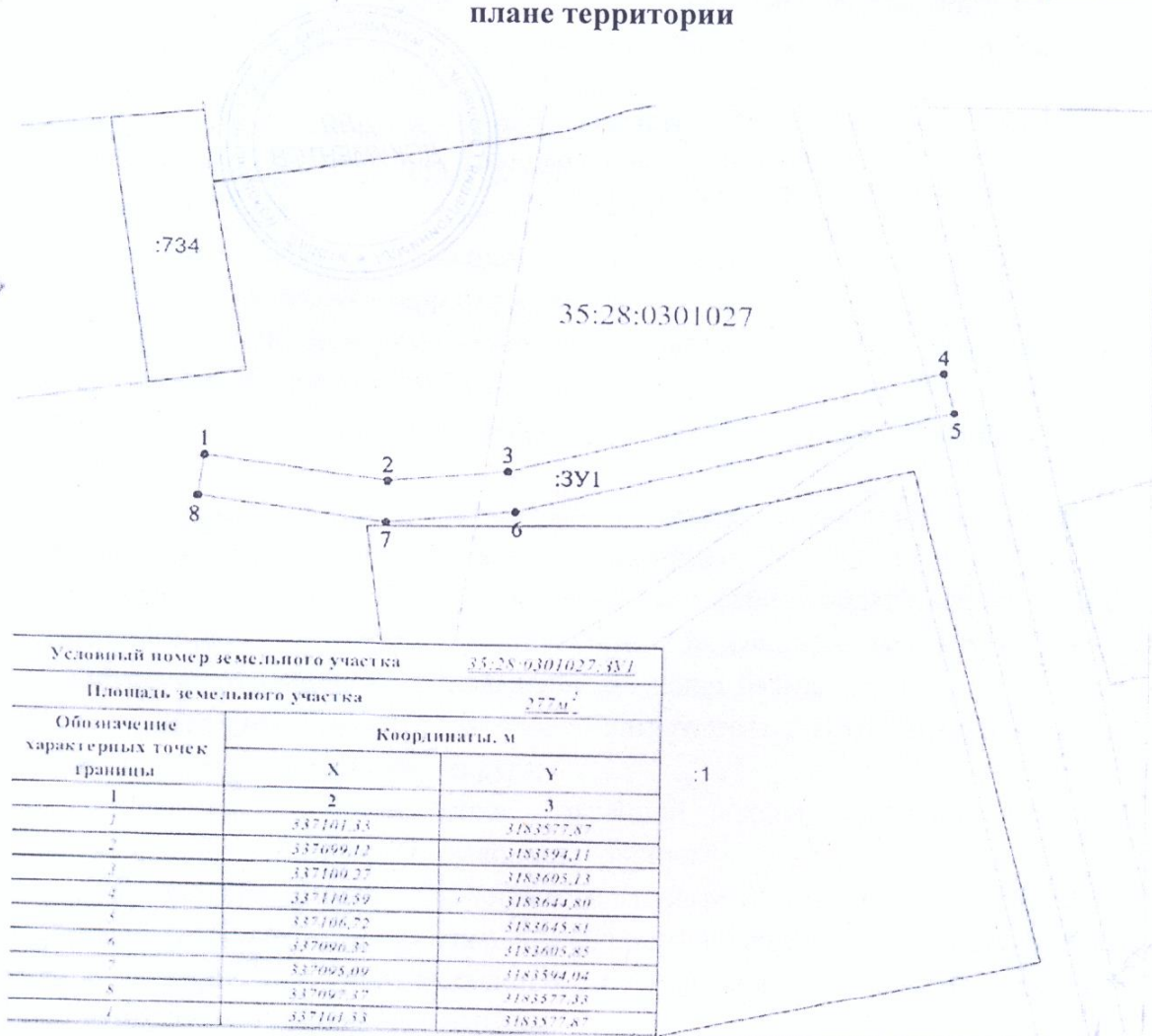
Схема границ предполагаемых к использованию земель на кадастровом плане территории