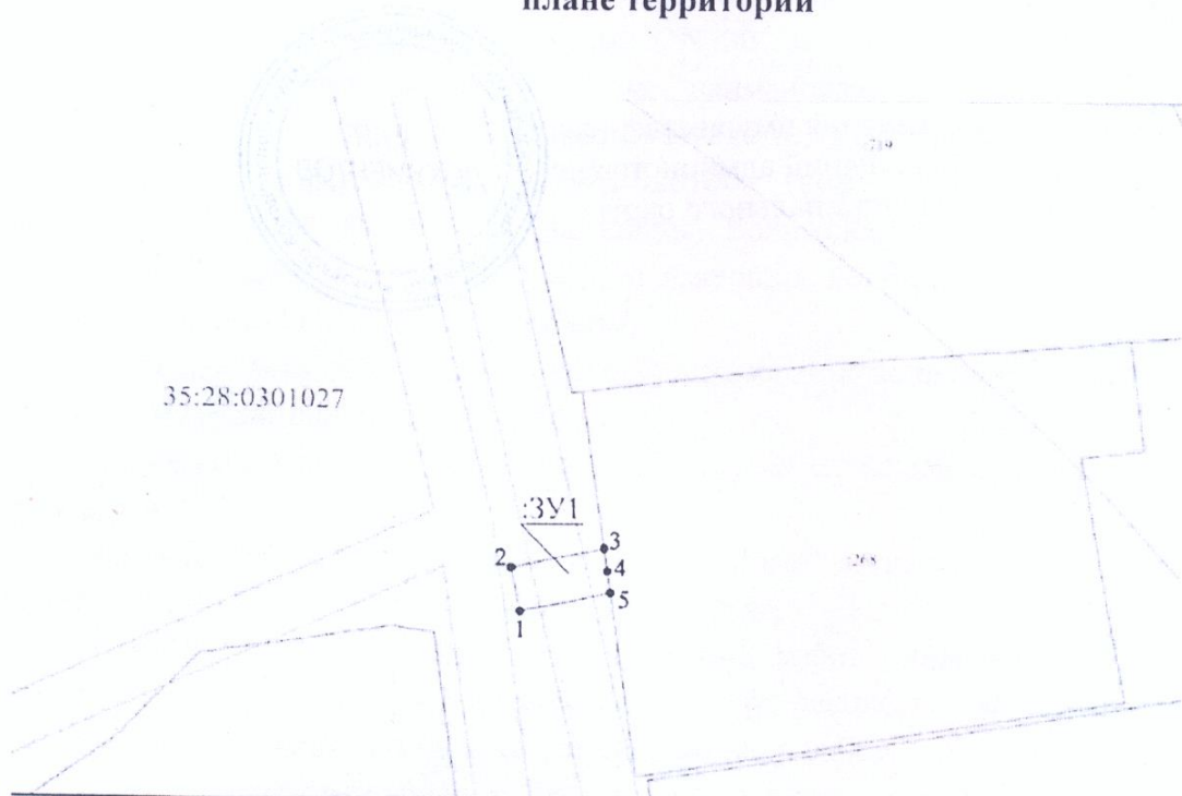
Схема границ предполагаемых к использованию земель на кадастровом плане территории